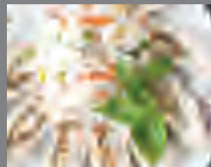
Блюда в вакууме