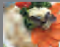
Блюда на пару